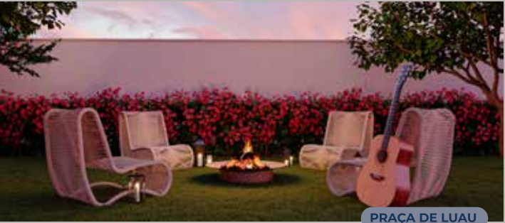
PRAÇA DE LUAU