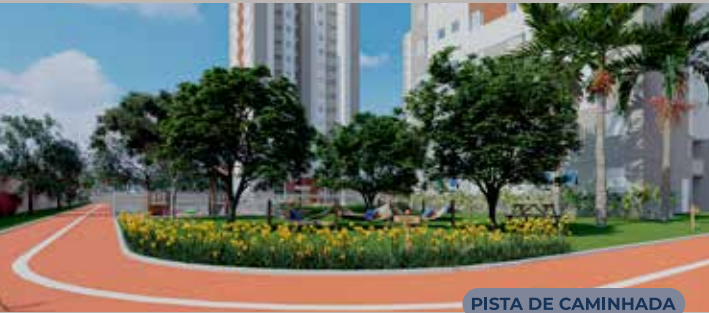
PISTA DE CAMINHADA