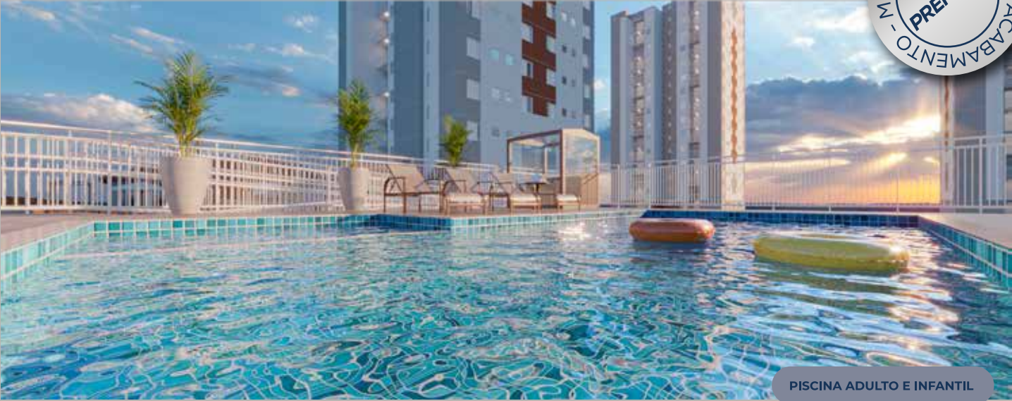
PISCINA ADULTO E INFANTIL